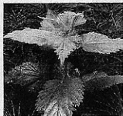
ネトルとは…ネトルの葉は、ヨーロッパでは古くから解毒・抗炎症の薬として使われてきた薬草です。「ビタミンファクトリー」の異名をもつほどビタミン・ミネラルが豊富。サラダやハーブティーとして食べたり、トゲトゲの葉で関節を治療した歴史もあります。

最近の研究で、ネトル（イラクサ）の中に、炎症を引き起こす免疫細胞を抑える働きがあることがわかりました。古くからヨーロッパに伝わる自然療法「ホメオパシー」の中にも『類似の法則（似たものが似たものを癒す）』というのがあります。ネトルに含まれるヒスタミン…本来ならアレルギーの引き金になる物質…を微量ずつ毎日体に入れることによって身体が慣れ、過剰反応しない身体になつていくというのです。これは、現代の減感作療法と同じ理論。実際にネトルパウダーを試した大半の方が体質の改善を感じています（右下表参照）。 しかも、プロ・アクティブのネトルはすべてオーガニック。それも、エネルギーが最も活性化している「若葉」だけを贅沢に使用しています。