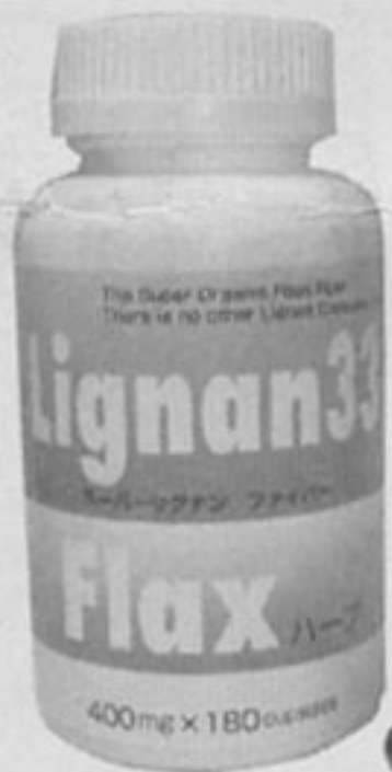
注目されるフラックスオイル