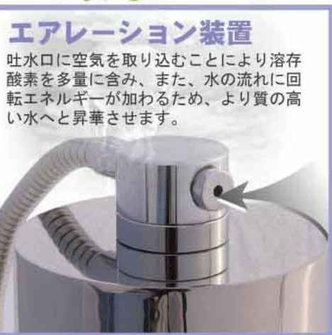
エアレーション装置 吐水口に空気を取り込むことにより溶存酸素を多量に含み、また、水の流れに回転エネルギーが加わるため、より質の高い水へと昇華させます。

それにより、逆流洗浄がとっても簡単に! 逆流洗浄がわずらわしい…! という方にぜひお勧めいたします。