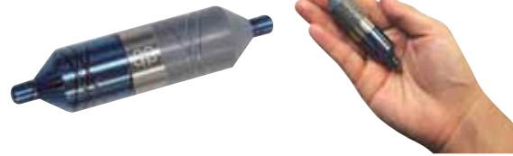
アポロ ピッコロ・シン (直径約 18×74mm) 99,000 円 (税込)

左回転のエネルギーが良くないとされるのは、秩序を乱す性質があるからで、逆に右回転のエネルギーには秩序を整える性質があります。健康な人、素直な人、親切な人、そういった気持ちの良い人は、右回転のエネルギーを出しています。しかし、何らかの不調を抱えた人、気むずかしい人、理屈っぽい人などには、真逆のエネルギー回転が起こっています。左回転がかなり強い人は、周囲を巻き込んでしまったり、事件を起こしてしまったりすることもあります。 左回転のエネルギーから身を守るために、持ち歩ける Weft としては「ピッコロ・シン」 がおすすめです。