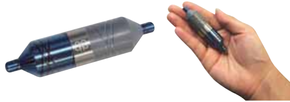
アポロ ピッコロ・シン (直径約 18×74mm) 99,000 円 (税込)

左回転のエネルギーが良くないとされるのは、秩序を乱す性質があるからで、逆に右回転のエネルギーには秩序を整える性質があります。健康な人、素直な人、親切な人、そういった気持ちの良い人は、右回転のエネルギーを出しています。しかし、何らかの不調を抱えた人、気むずかしい人、理屈っぽい人などには、真逆のエネルギー回転が起こっています。左回転がかなり強い人は、周囲を巻き込んでしまったり、事件を起こしてしまったりすることもあります。 左回転のエネルギーから身を守るために、持ち歩ける Weft としては「ピッコロ・シン」 がおすすめです。