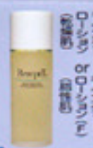
ディーツールフェイスハセルモイスタチャーローション