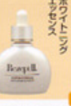
ホワイトニングエッセンス

容器をよく振って、スポイトに1/3くらいを手にとり、前にパティング。 ※朝夜使用