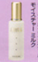
ディーツールフェイスハセルモイスタチャーミルク