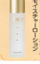
ディーツールフェイスハセルモイスタチャーローション

容器をよく振って、スポイトに1/3くらいを手にとり、前にパティング。 ※朝夜使用