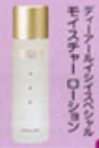
ディーツールフェイスハセルモイスタチャーローション