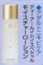
ディープクレンジングディーツールフェイスハセルモイスタチャーローション