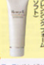
クレンジングフォーム

2〜3プッシュ手にとり、顔全体にのばした後、指先が軽くなったら洗い流します。又は拭き取ります。 ※夜のみ使用 ※湿気の少ない所で使用