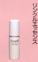
リソウルセオッセンス

よく振って1〜3プッシュを手にとり気になる部分に軽くパティングしながらのばします。 ※朝夜使用