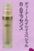
ディーツールフェイスハセルモイスタチャークリーム