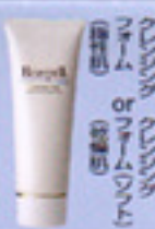
クレンジングフォーム

2〜3プッシュ手にとり、顔全体にのばした後、指先が軽くなったら洗い流します。又は拭き取ります。 ※夜のみ使用 ※湿気の少ない所で使用