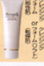
クレンジングフォーム

2〜3プッシュ手にとり、顔全体にのばした後、指先が軽くなったら洗い流します。又は拭き取ります。 ※夜のみ使用 ※湿気の少ない所で使用