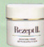
モイスタチャークリーム