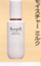
モイスタチャーミルク