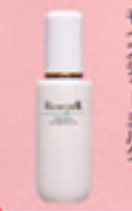
ディーツールフェイスハセルモイスタチャーミルク