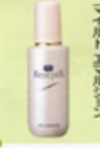
マイルドクレンジングフォーム

2〜3プッシュ手にとりよく泡立ててからこすらず泡をのせるように洗います。すすぎは十分に。 ※朝夜使用