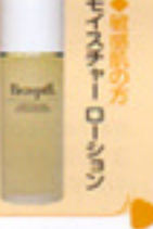
ディーツールフェイスハセルモイスタチャーローション