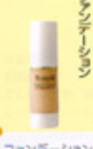
モイスタチャークリーム