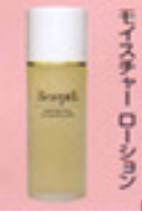
ディーツールフェイスハセルモイスタチャーローション