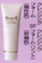
クレンジングフォーム

2〜3プッシュ手にとり、顔全体にのばした後、指先が軽くなったら洗い流します。又は拭き取ります。 ※夜のみ使用 ※湿気の少ない所で使用