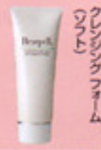
クレンジングフォーム

2〜3プッシュ手にとり、顔全体にのばした後、指先が軽くなったら洗い流します。又は拭き取ります。 ※夜のみ使用 ※湿気の少ない所で使用