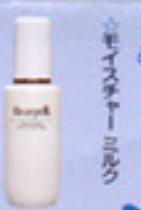
モイスタチャーミルク